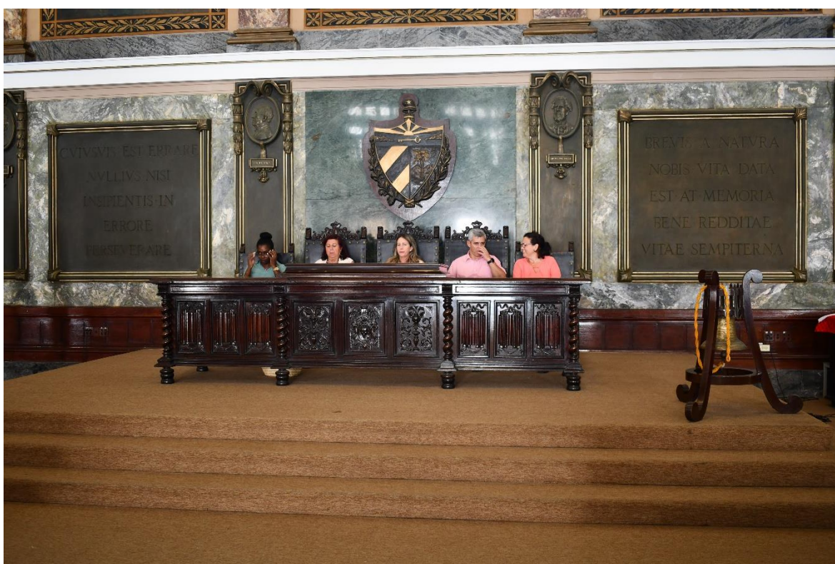
Mesa presidencial de la Ceremonia de Clausura

En primer lugar, una cantante cubana interpreta dos canciones típicas del folklora cubano.