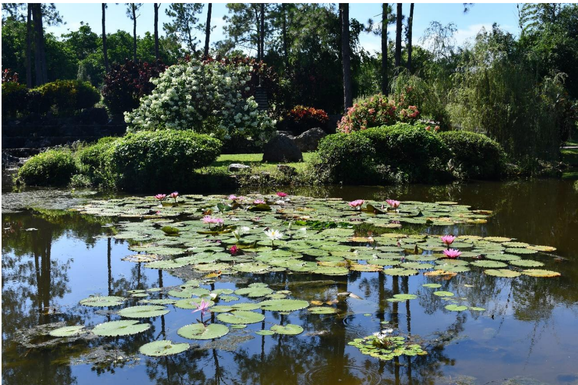
Visita al Jardín Botánico Nacional de Cuba