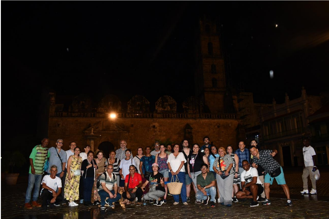
Visita de los delegados a la ciudad de La Habana