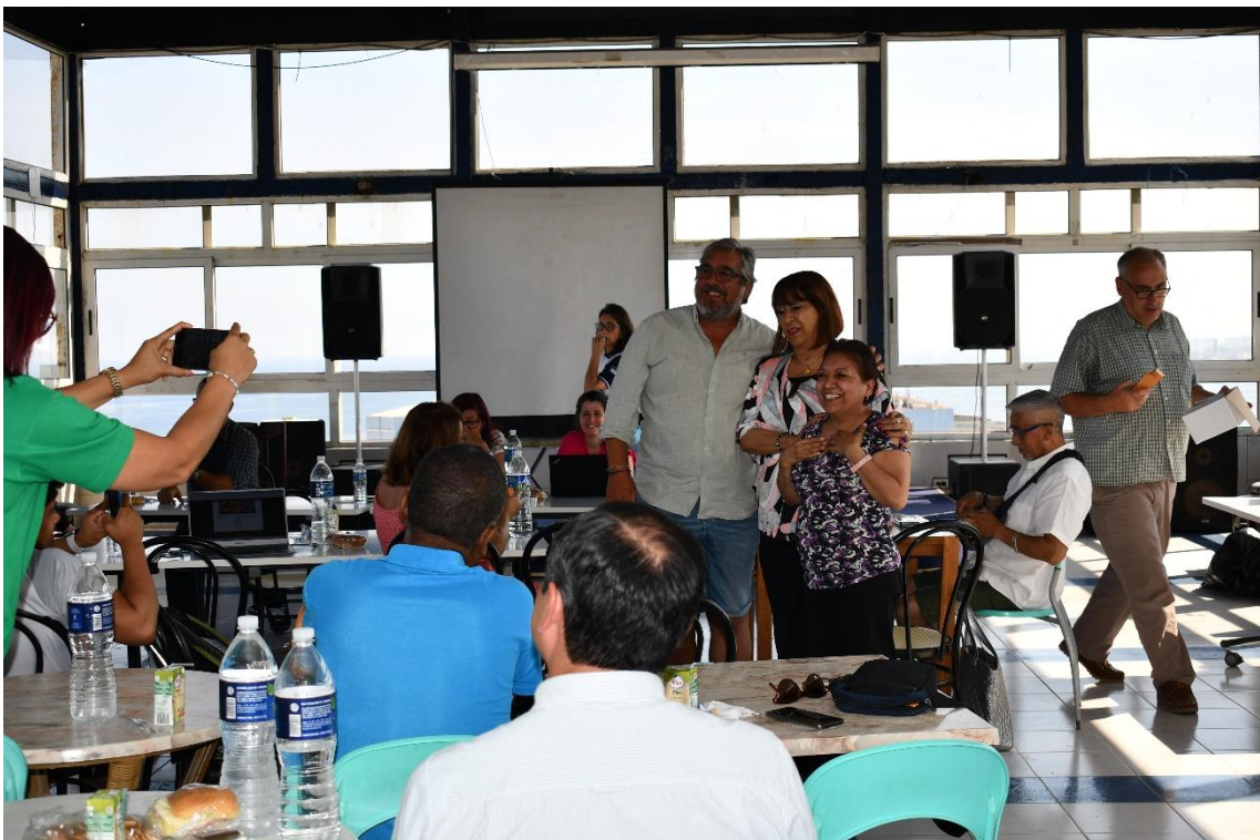
Los 3 delegados que actuarán como coordinadores de la OIAB los próximos 3 años