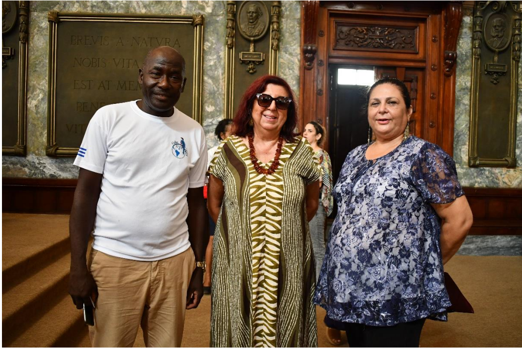
La Coordinadora general de la OIAB entre las autoridades del Ministerio de Educación de Cuba