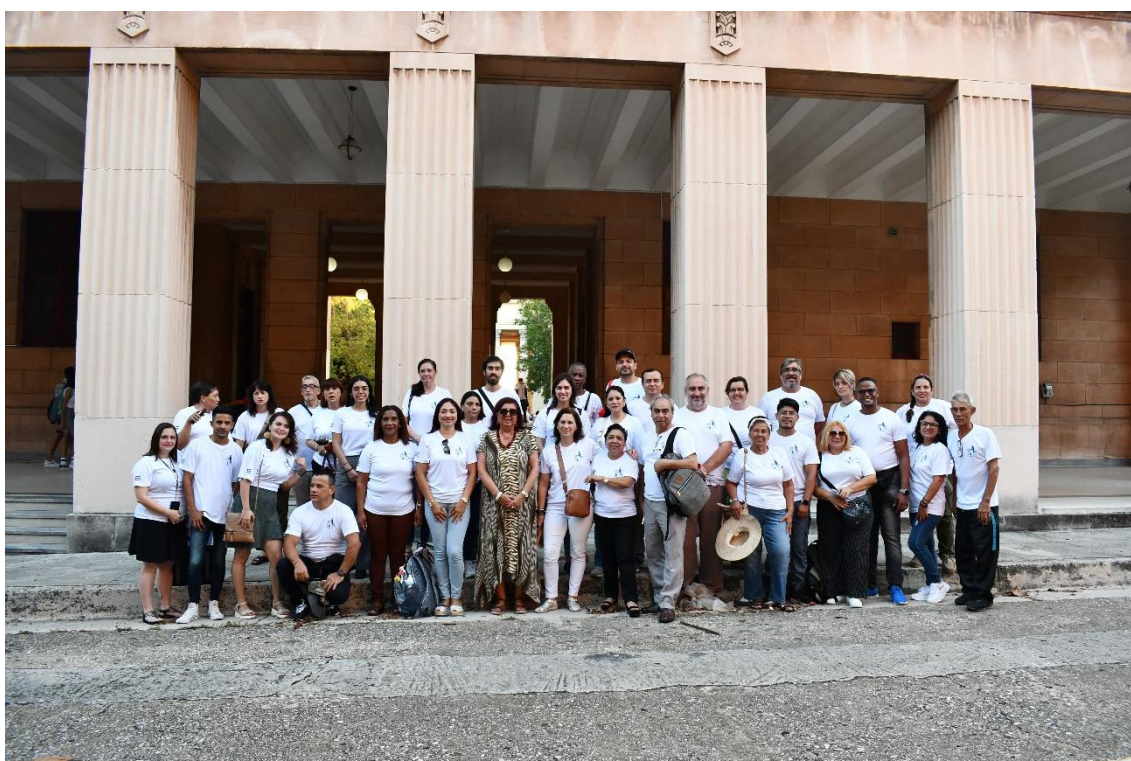
Delegados de los diversos países participantes