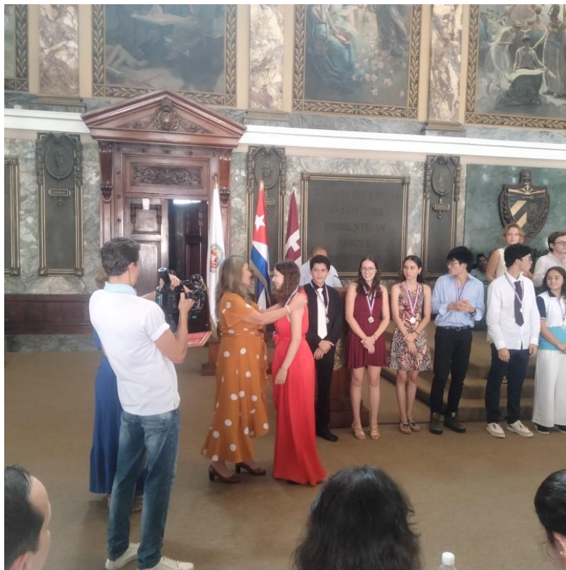
La Ministra de Educación de Cuba hace entrega de las medallas de plata