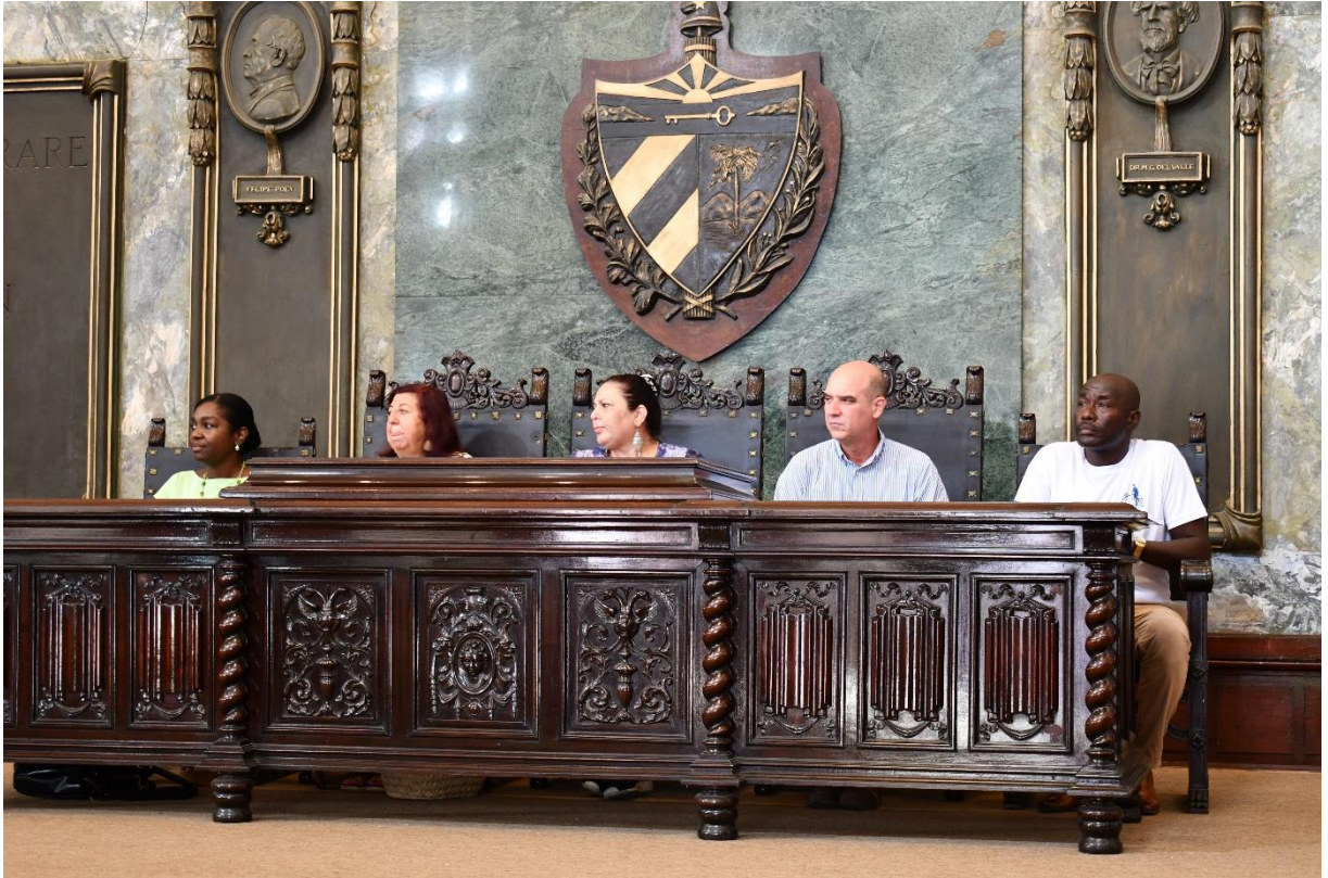
Mesa presidencial del Acto de Inauguración de la XVII Olimpiada Iberoamericana de Biología, en el Aula magna de la Universidad de La Habana