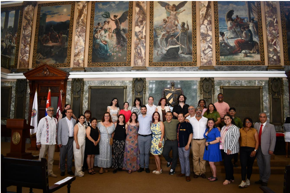
Delegados de todos los países iberoamericanos en el Aula Magna de la Universidad de La Habana, antes de comenzar el acto de clausura