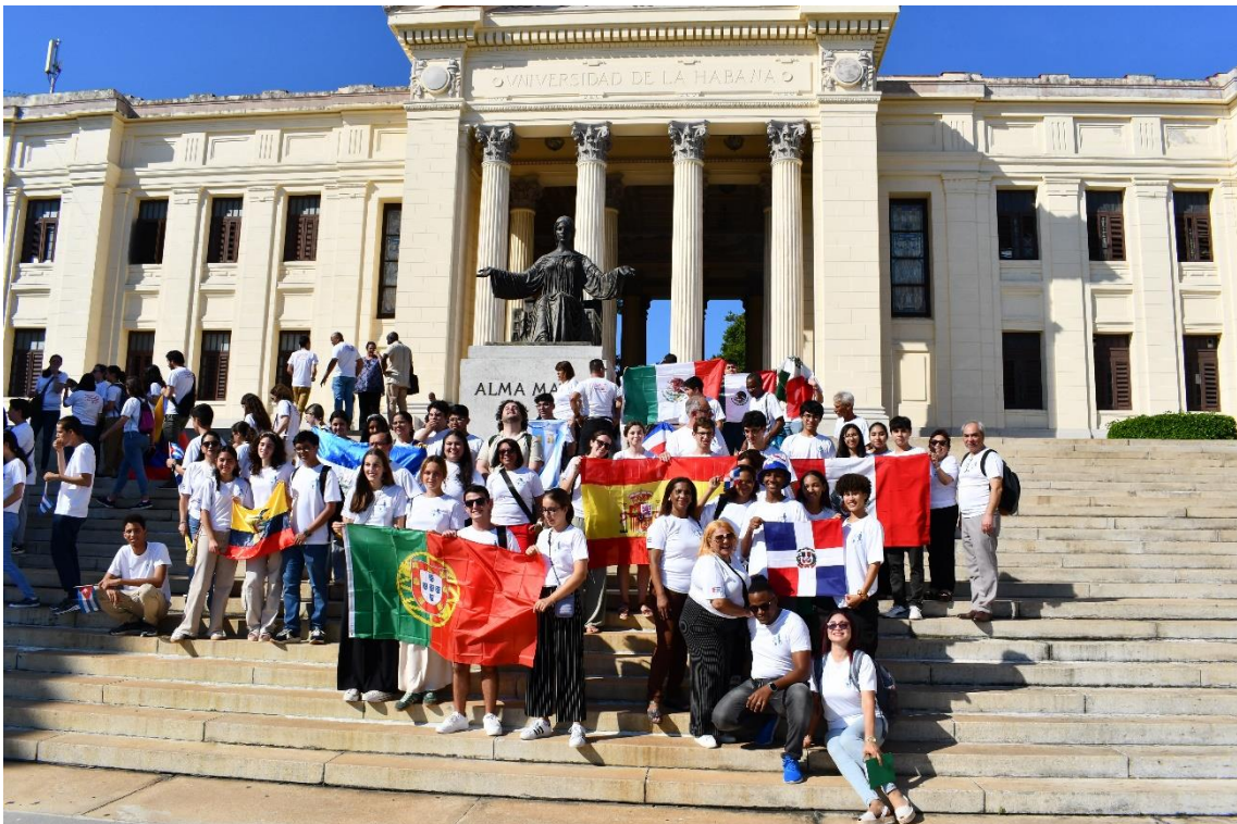
Exterior de la Universidad de La Habana con todos los participantes en la OIAB 2024