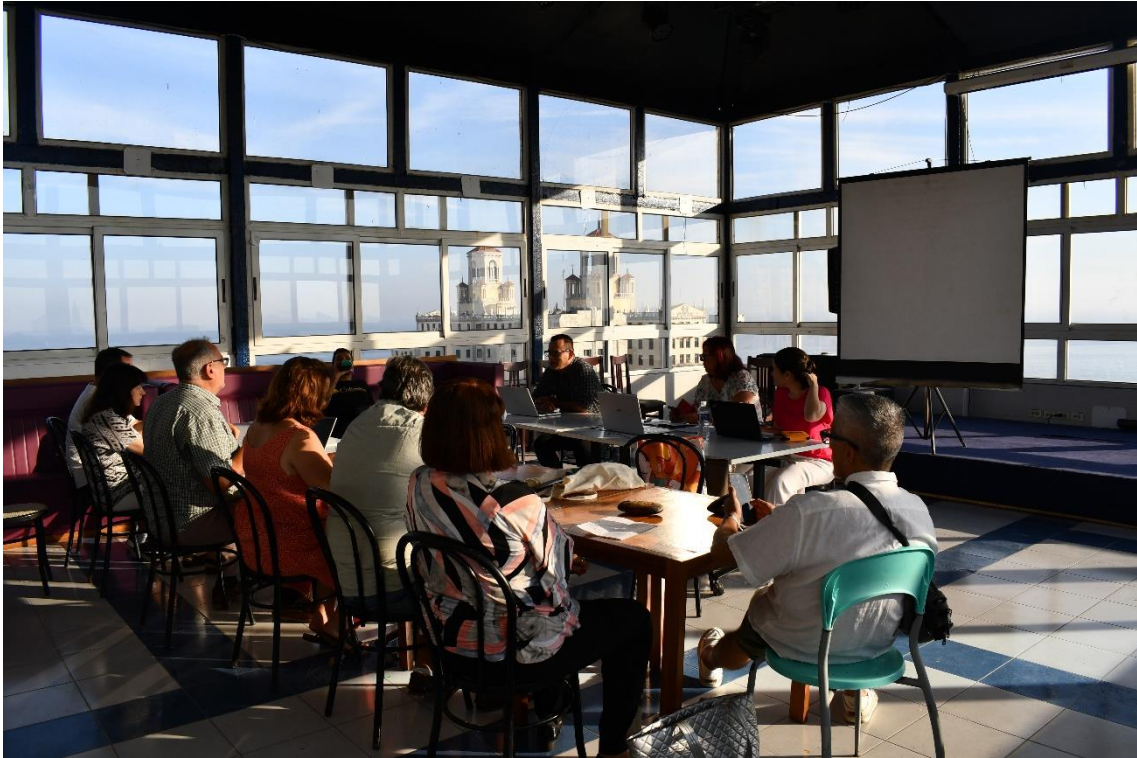
Aspecto de la Asamblea anual de delegados