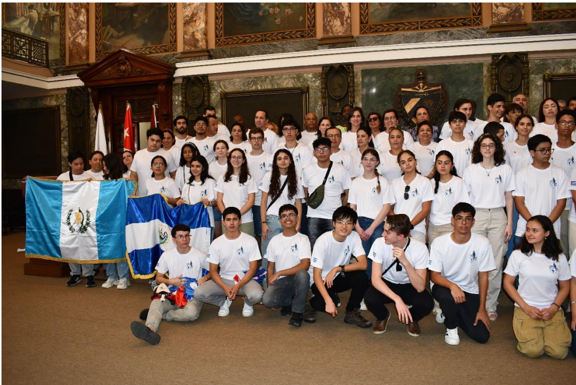
Participantes en la XVII Olimpiada Iberoamericana de Biología